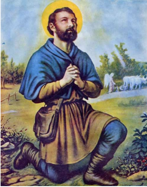
St. Isidore, image used for Kouzen Zaka