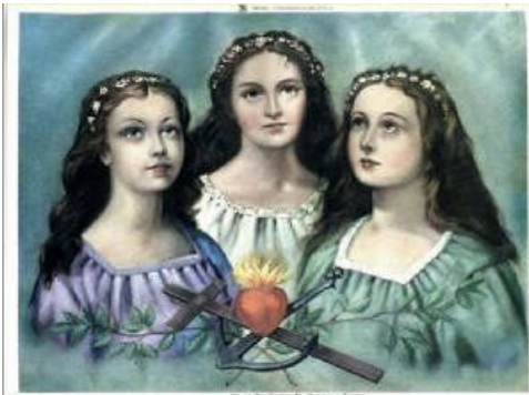
The Three Virtues