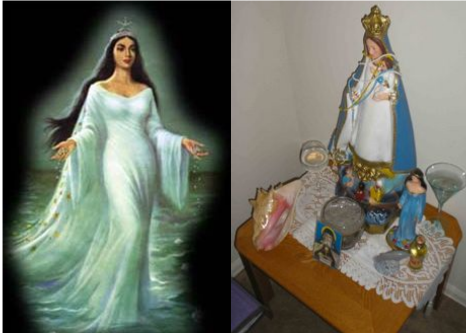
Mambo LaSirene, the Mermaid