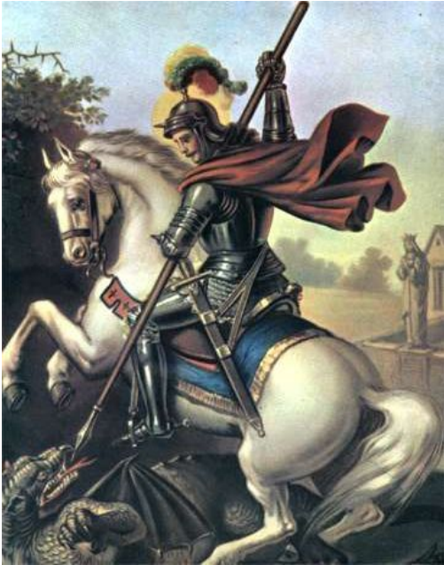
This image is used for Ogou in Petro aspects